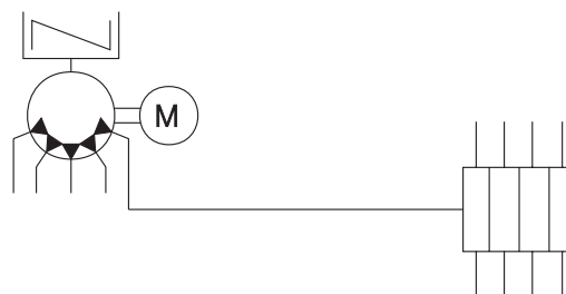
Diagrama de funcionamento

Estas bombas de lubrificação podem ser construídas com diversos tipos de acionamento, tais como: manual, elétrico ou mecânico (rotativo, came, excêntrico, etc.). Seus reservatórios de lubrificante tem as dimensões adequadas para cada projeto, o que proporciona bastante flexibilidade em suas aplicações.